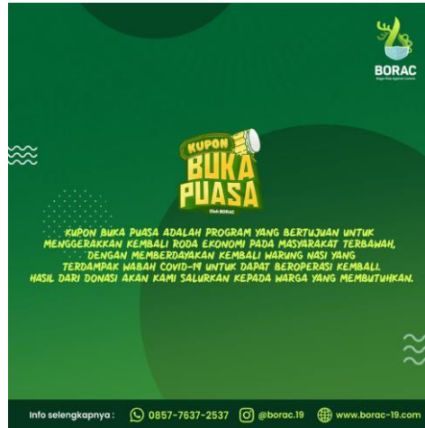
Gambar 4. Program Kupon Buka Puasa Komunitas Bogor Rise Against Corona

Program yang kedua adalah Kupon Buka Puasa yang merupakan program mengumpulkan donasi untuk mensponsori warteg atau sekelas kedai makan yang terkena dampak COVID 19 dengan tujuan menjaga mata rantai perekonomian pangan sekaligus memecahkan masalah kelaparan bagi warga di sekitar warteg tersebut. Program ini diaktivasi dengan membagikan kupon makan, yang bisa diambil sebelum buka puasa.