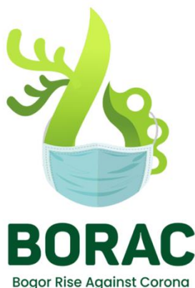
Gambar 1. Logo Komunitas Bogor Rise Against Corona

BORAC atau Bogor Rise Against Corona merupakan sebuah inisiasi dari pemuda Bogor Raya serta dari pergerakan lintas komunitas. Berawal dari sebuah isu COVID 19 sehingga memiliki keinginan untuk bergotong royong membantu masyarakat yang terkena dampak dari COVID 19.