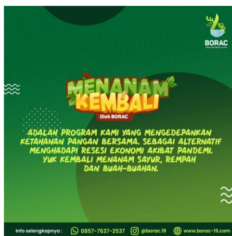
Gambar 5. Program Menanam Kembali Komunitas Bogor Rise Against Corona

Program terakhir yaitu Menanam Kembali yaitu konsep memindahkan pertanian konvensional ke wilayah perkotaan yang mengutamakan produksi hasil pertanian untuk ketahanan pangan wilayah perkotaan. Berawal dari pemikiran bagaimana caranya penduduk tetap bisa makan walaupun dari hasil yang mereka tanam. Kemudian BORAC membuat satu control center atau Balai Bibit untuk menumbuhkan berbagai macam benih jadi bibit dan ditumbuhkan yang kemudian memiliki target untuk mendistribusikan 10.000 bibit ke kecamatan di Kota dan Kabupaten Bogor. Ada sekitar 16 spesies tanaman yang bisa ditumbuhkan dengan mudah salah satunya cabai, caisin, selada dan bayam merah. Program ini bekerjasama dengan Pemkot dengan Dinas Pertanian dengan memberikan bibit kepada BORAC.