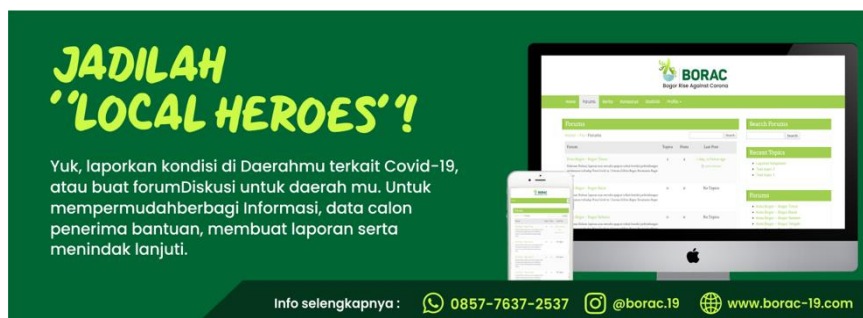
Gambar 2. Program Local Heroes Komunitas Bogor Rise Against Corona

tersebut yang membutuhkan bantuan, mencari lokasi untuk melakukan program aktivasi Kupon Buka Puasa, dan lain sebagainya.