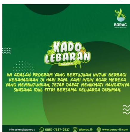
Gambar 3. Program Kado Lebaran Komunitas Bogor Rise Against Corona

Ada tiga program yang dijalankan oleh BORAC; Kado Lebaran, Kupon Buka Puasa, dan Menanam Kembali. Bekerjasama dengan KitaBisa, program Kado Lebaran merupakan program yang bertujuan agar masyarakat yang terkena dampak COVID 19 tetap dapat menikmati hangatnya suasana hari raya idul fitri bersama keluarga dirumah. Kado Lebaran berisi parcel bahan makanan pokok, kebutuhan sandang, serta kue lebaran.